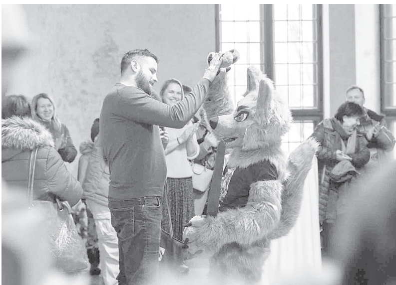
Mednieku stāsti un dzīvnieku un putnu izbāzeņi apskatāmi Cesvaines pilī un Cesvaines tūrisma centrā. Medniekus sveica arī vietējais Cesvaines pils vilks