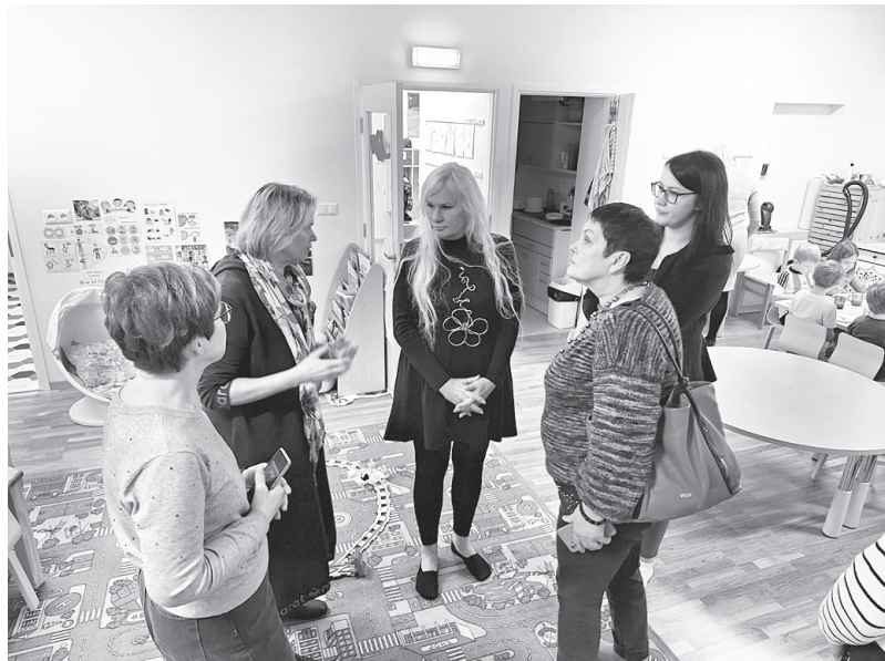
Apskatot vienu no pilsētas bērnu darziem

iepazīnām ražotnes ikdienas darbu un problēmas, ar kurām saskaras uzņēmēji.