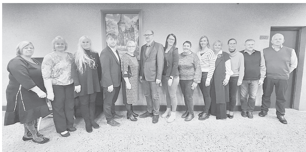
Pēc oficiālajām sarunām un tikšanās Merjamā pašvaldības ēkā

Ar pašvaldības pārstāvjiem tikāmies un sarunājāmies pašvaldības domē, apskatījām administrācijas ēku. Apmeklējām Merjamā pilsētas bibliotēku, bērnu darzu, mākslas skolu, kā arī Vanavīgas kultūras centru, kur darbojas keramikas studija. Tika apmeklēti arī tūrisma objekti – tradicionālās amatniecības un rokdarbu māja,