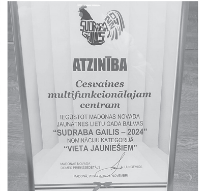
Saņemot pateicību un apbalvojumus pasākumā „Sudraba gailis”

bērnu un jauniešu izaugsmei un vajadzībām nepieciešamās norises; būt vieta, kur jauniešus iedrošina, mēģina saprast, izprast un kur viņu iniciatīvas un idejas atbalsta par visiem 89,3 %.