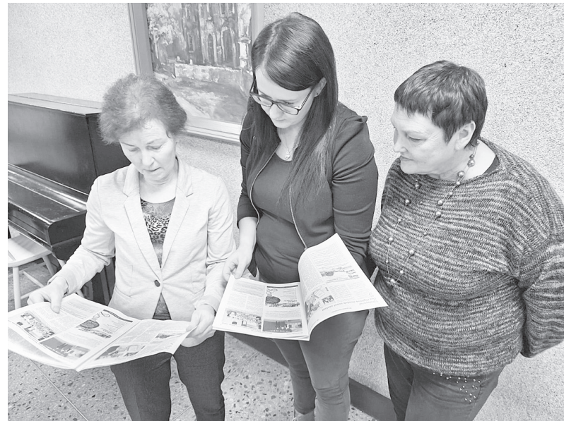
Kopā ar redaktori, iepazīstot Merjamā informatīvo izdevumu un tā tapšanu