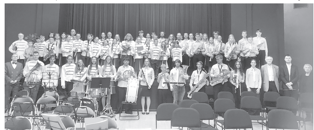
Raplas novada jauniešu pūtēju orķestris un Gulbenes Mūzikas skolas pūtēju orķestris