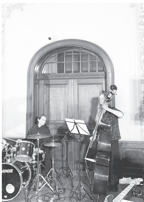
Ziemassvētku sajūtu ieskaņas pasākumā, kas bija veltīts Cesvaines vidusskolas pirmā latviešu valodas un literatūras skolotāja rakstnieka Augusta Saulieša 155. jubilejai, izskanēja Rīgas Doma kora skolas audzēkņu koncertprogramma, kurā tika atskaņotas dziesmas ar džeza un rokenrola žanra iezīmēm un Augusta Saulieša dzeju