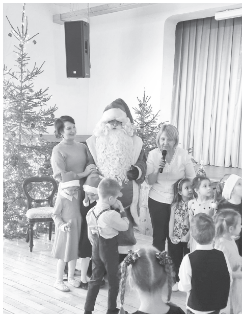
Sirsnīgā, muzikālā svētku pasākuma gaisotnē mazākie cesvainieši guva svētku prieku