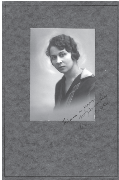
Marija Ezeriņa Madonas muzeja krājums