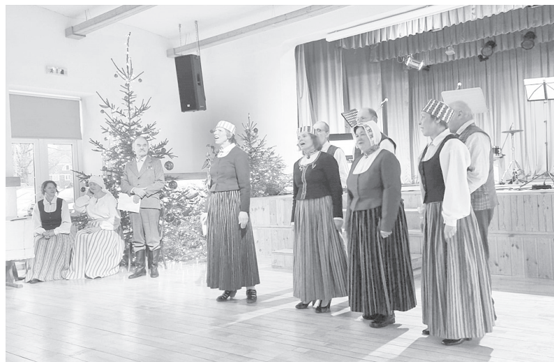
Folkloras kopa „Krauklēnieši” jubilāru sveica ar tradicionālām dziesmām, kas pierakstītas Cesvaines apkārtnē