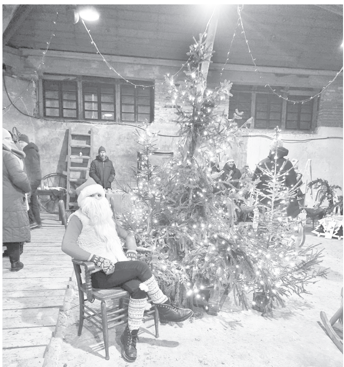
Eglītes iedegšanas pasākumā svētku sajūtu bija iespējams gūt arī Cesvaines pilsmuižas staļļos: pankūku smarža virmoja gaisā, skanēja dziesmas, kājas pašas vedināja rotaļās