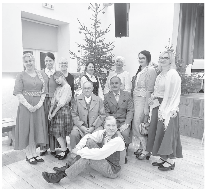
Rakstnieka dzimšanas dienā, 22. decembrī, jubilejas pasākums norisinājās arī Cesvaines kultūras namā. Piedaloties Cesvaines amatiereteātrim, folkloras kopai „Krauklēnieši”, tika atveidotas stilizētas Augusta Saulieša jubilejas svinības, kurās tika lasīti Saulieša dzejoļi un tēlojums