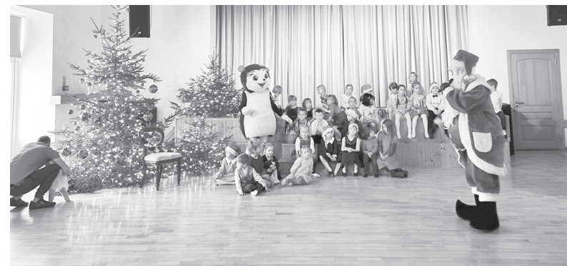
Pašus mazākos Cesvaines iedzīvotājus ciemos uz kultūras namu aicināja Ziemassvētku vecītis