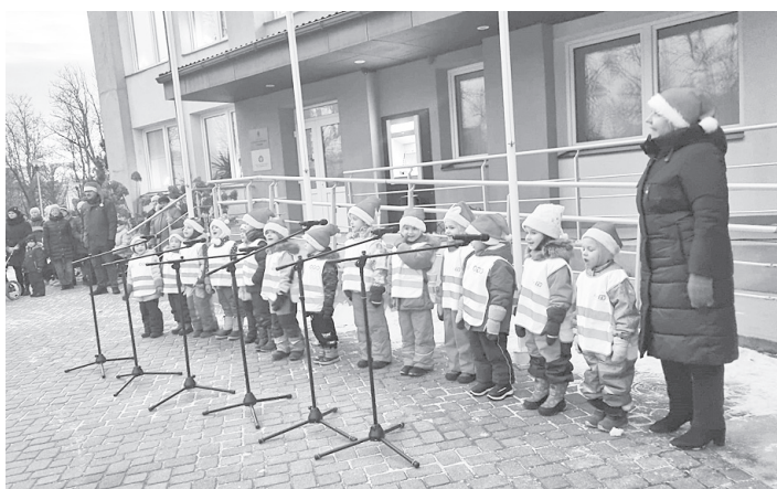
Svētku laiks ierasti sākas ar Ziemassvētku eglītes iedegšanu pie pārvaldes ēkas Cesvainē. Lieli palīgi svētku rūķiem bija Cesvaines pirmskolas „Brīnumzeme” dziedošie censoņi, ar kuru palīdzību galvenā svētku rota spoži iemirdzējās