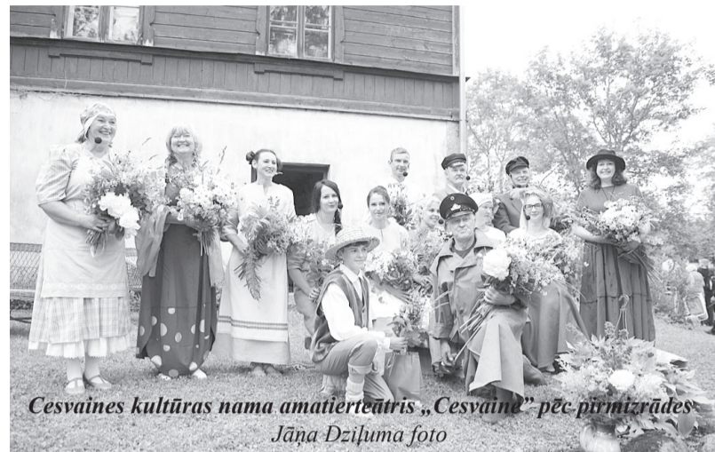
Cesvaines kultūras nama amatierteātris „Cesvaine” pēc pirmizrādes