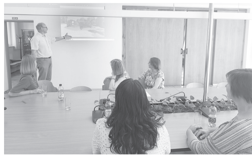
Publiski tika apspriestas vairākas idejas