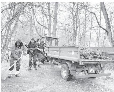
Cesvainē aktīvi tiek vāktas koku lapas