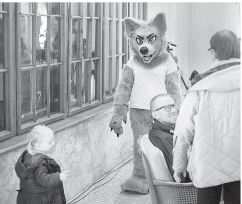
Pils viesus sagaidīja pils talismans un sargs – vilks

Notikuma mērķis ir uz vienu vakaru ļaut apmeklētājiem pils un muižas ieraudzīt neierastā veidā – caur dažādām norisēm izziņāt vēsturi un iepazīt kultūras mantojumu. Šā gada notikuma tēma – VĒSTULES.